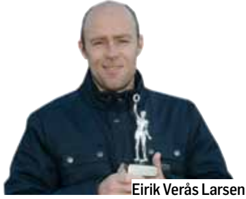
Eirik Verås Larsen