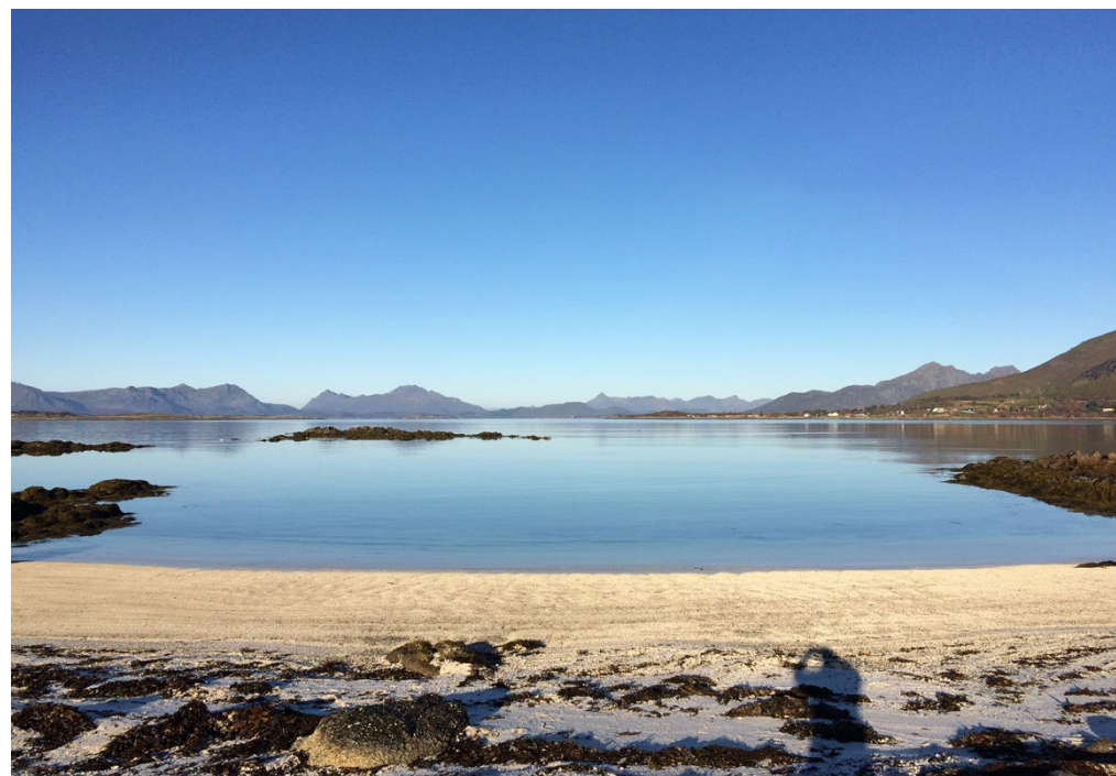
Det må ett nytt verdigrunnlag til.

Vi skal ikke tilbake til steinalderen, men må spille på lag på lag med natur og miljø og innse at planeten har begrensede ressurser som må forvaltes langsiktig med omtanke for våre etterkommere.