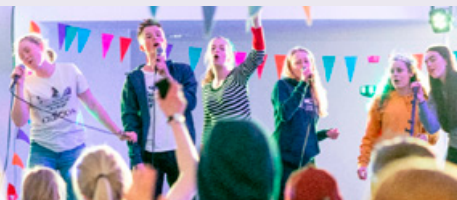
Natt til 1. mai tar ungdommen over scenen på Sverresborg Kirkesenter!

På Sverresborg kirkesenter har vi babysang hver mandag, samtidig er det åpen kafé for alle kl. 11.00-14.00 . På grunn av stor interesse for babysang, har vi to grupper, og man kan være med på den som passer best. Vi samles kl.11.30 og kl.13.00 . Kom med den stemmen du har, for barnet er det den vakreste av alle! Facebook: Babysang i Sverresborg kirkesenter .