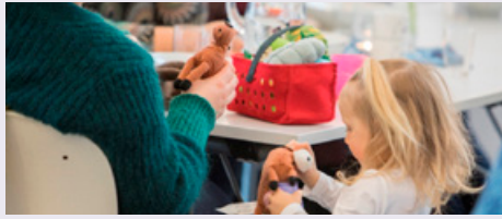
På Kirketorsdag kan barna komme i gang med leken, mens de voksne fortsatt sitter med kaffekoppen og skravler.

18ish er et uformelt møtested for unge voksne i menigheten, enten man har lederansvar eller bare har lyst å henge med andre. Vi samles gjerne over et måltid, snakker om stort og smått og fokuserer på fellesskap, åpenhet, kos og hygge. Lurer du på noe, ta kontakt med amanda@gerhardsenkarlsen.com