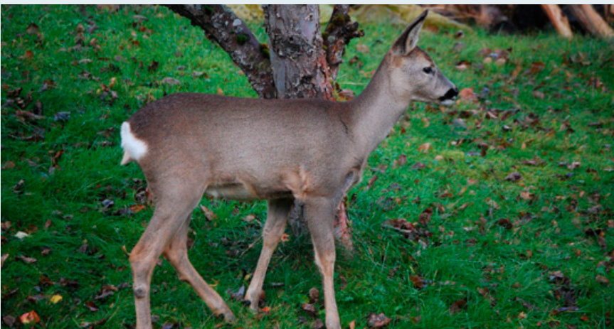
Genetisk er det lite forskjell på epletre, rådyr og mennesker.

Men Frans hadde egentlig mer rett enn han selv visste. Vår tids genetiske kunnskap bekrefter at alt livet på jorda er i slekt. Rent genetisk er det liten forskjell på meg og på rådyret og epletreet utenfor vinduet mitt. Og Frans understreker særlig vårt slektskap med jorda ved å kalle henne både søster og mor.