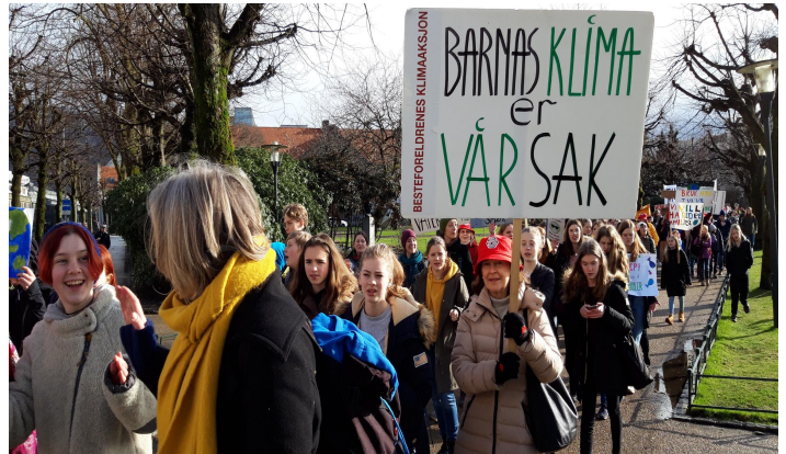
19. Klimaopprøret 14. mars 2019

Så var det ungdommen i Bergen som i 2018 startet sitt Klimaopprør . Vi koblet oss på deres protest. Det ble store marsjer i Bergen sentrum, særlig i 2019 da ungdommen fulgte opp etter Greta Thunbergs skolestreik. Siste gang rakk folketoget rundt hele Lillelungeren!