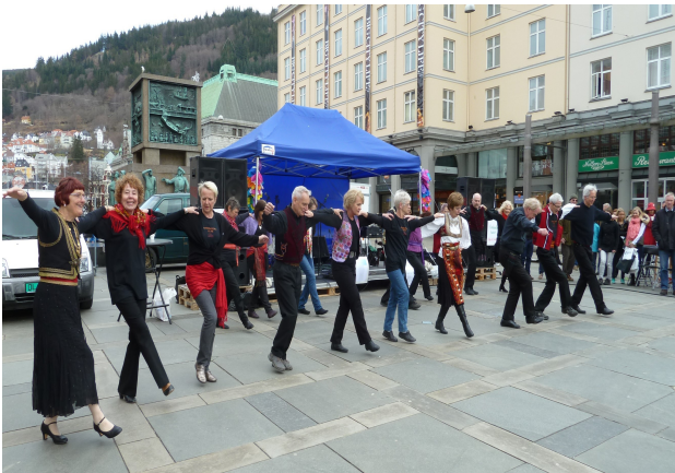
7. Greske danser