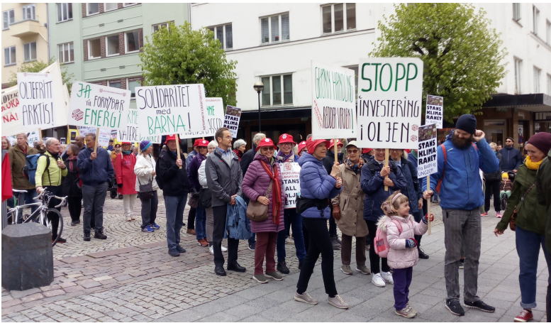
19. Vi var med i 1. maitog 2019

Så var det ungdommen i Bergen som i 2018 startet sitt Klimaopprør . Vi koblet oss på deres protest. Det ble store marsjer i Bergen sentrum, særlig i 2019 da ungdommen fulgte opp etter Greta Thunbergs skolestreik. Siste gang rakk folketoget rundt hele Lillelungeren!