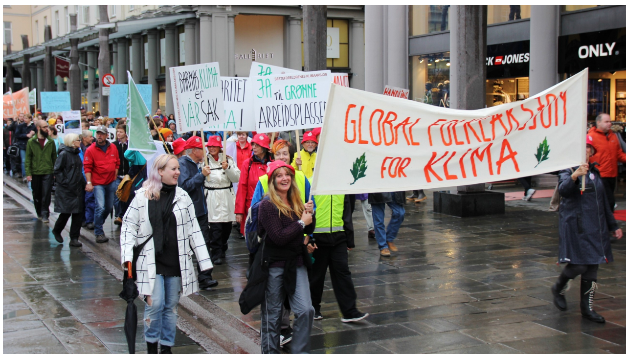
10. Global folkeaksjon for klima 10. sept 2014