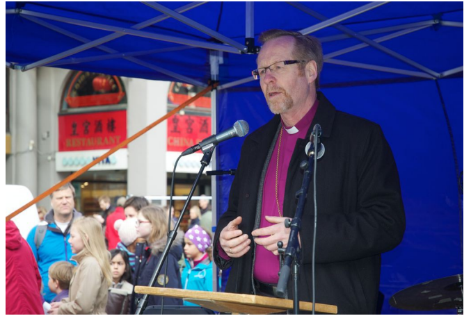
4. Appell ved biskop Halvor Nordhaug