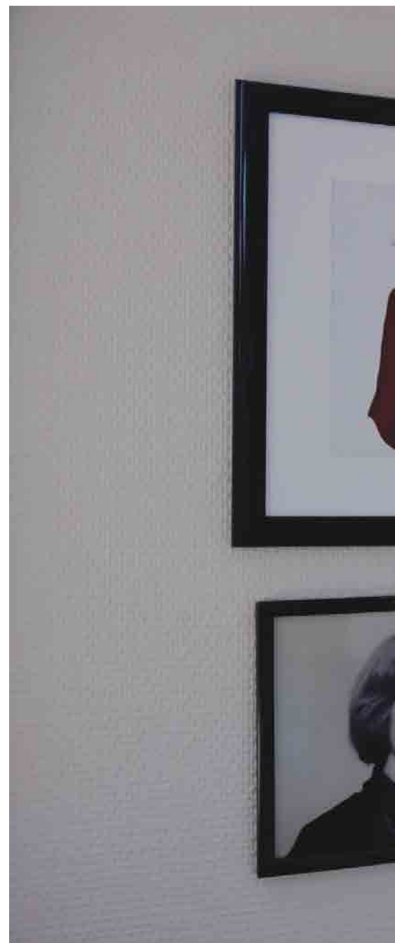
DET SOM TELLER: I leiligheten i Bergen har biblio