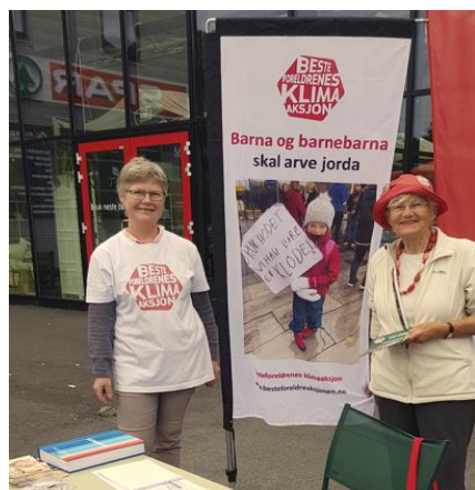
Stand i Eikelandssosen