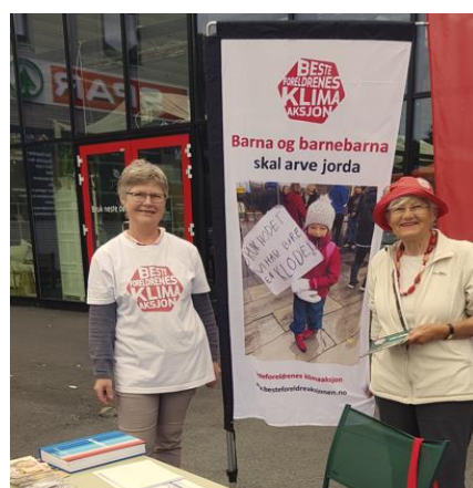
Stand i Eikelandssosen